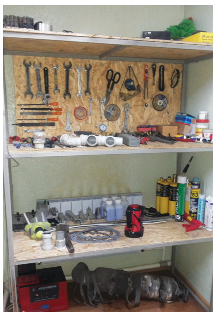
Все по полочкам - в холодильной службе