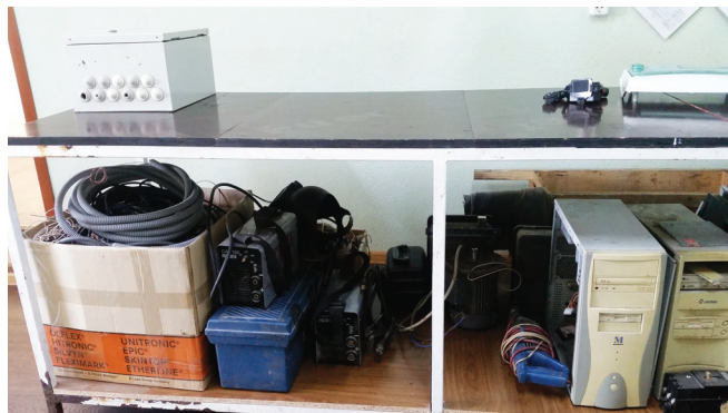
Это тоже в АСУТП - не верите?!