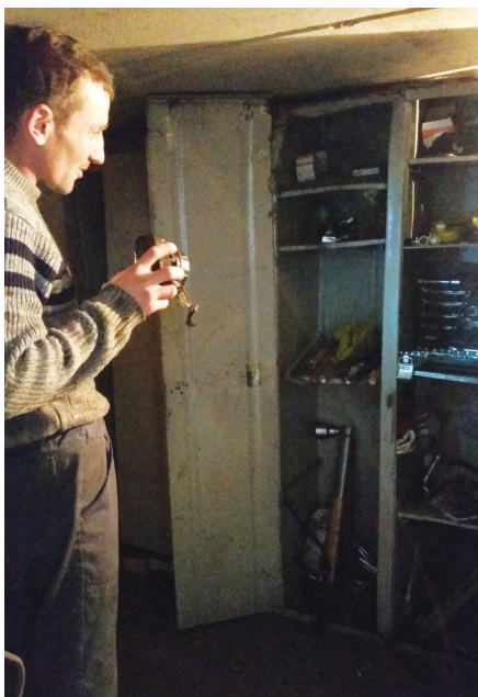
В гидролизном цехе все показали и много рассказали