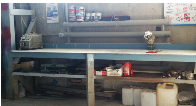
РМС обустривается на новом месте: к работе готовы