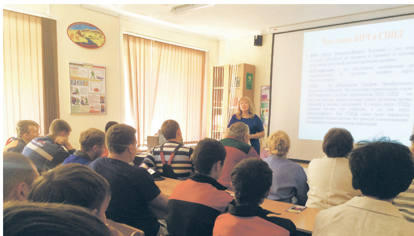
Все, что вы не знали о СПИД/ВИЧ

Спасибо медицинским работникам за профессиональный подход и полезный диалог!