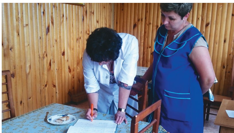
Медицинский работник проводит бракераж

Больше фото и других материалов на www.aknar-pf.kz и Facebook (просто наберите «Акнар ПФ»)