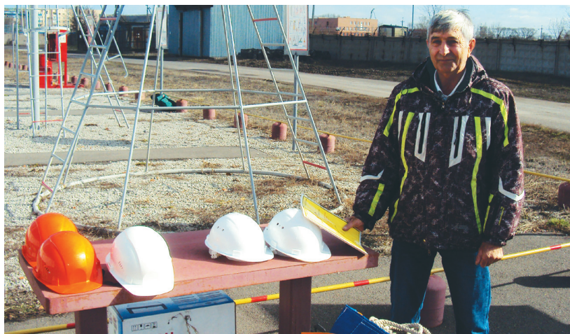
Месячник безопасности, 2017 г.

Больше фото и других материалов на www.aknar-pf.kz и Facebook (просто наберите «Акнар ПФ»)