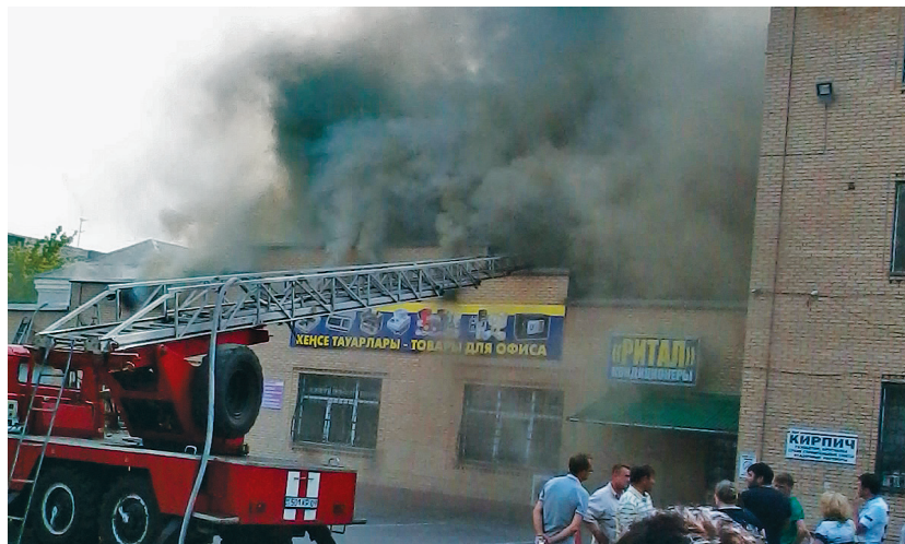
Тушение пожара. Караганда, 2017 г.

Любая чрезвычайная ситуация, вызванная человеческими и нечеловече-