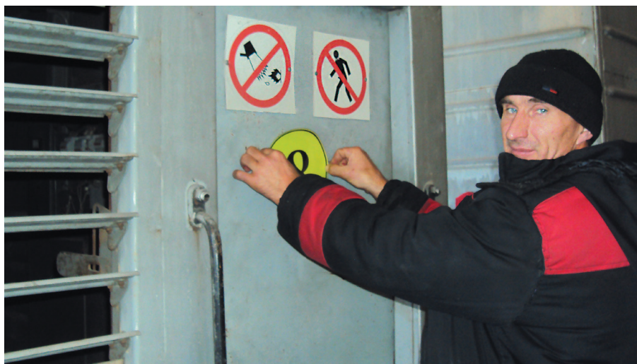
Образец оснащения наглядным материалом вагона-рефрижератора №8