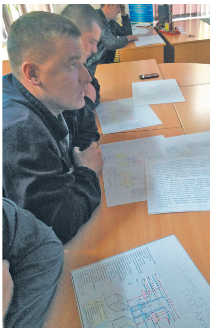
Знаем. Понимаем. Делаем.